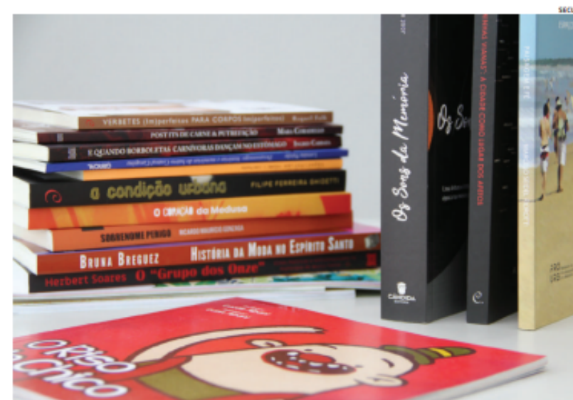
As obras literárias reúnem um mosaico de gêneros, como poesia, contos, romance e infantojuvenil